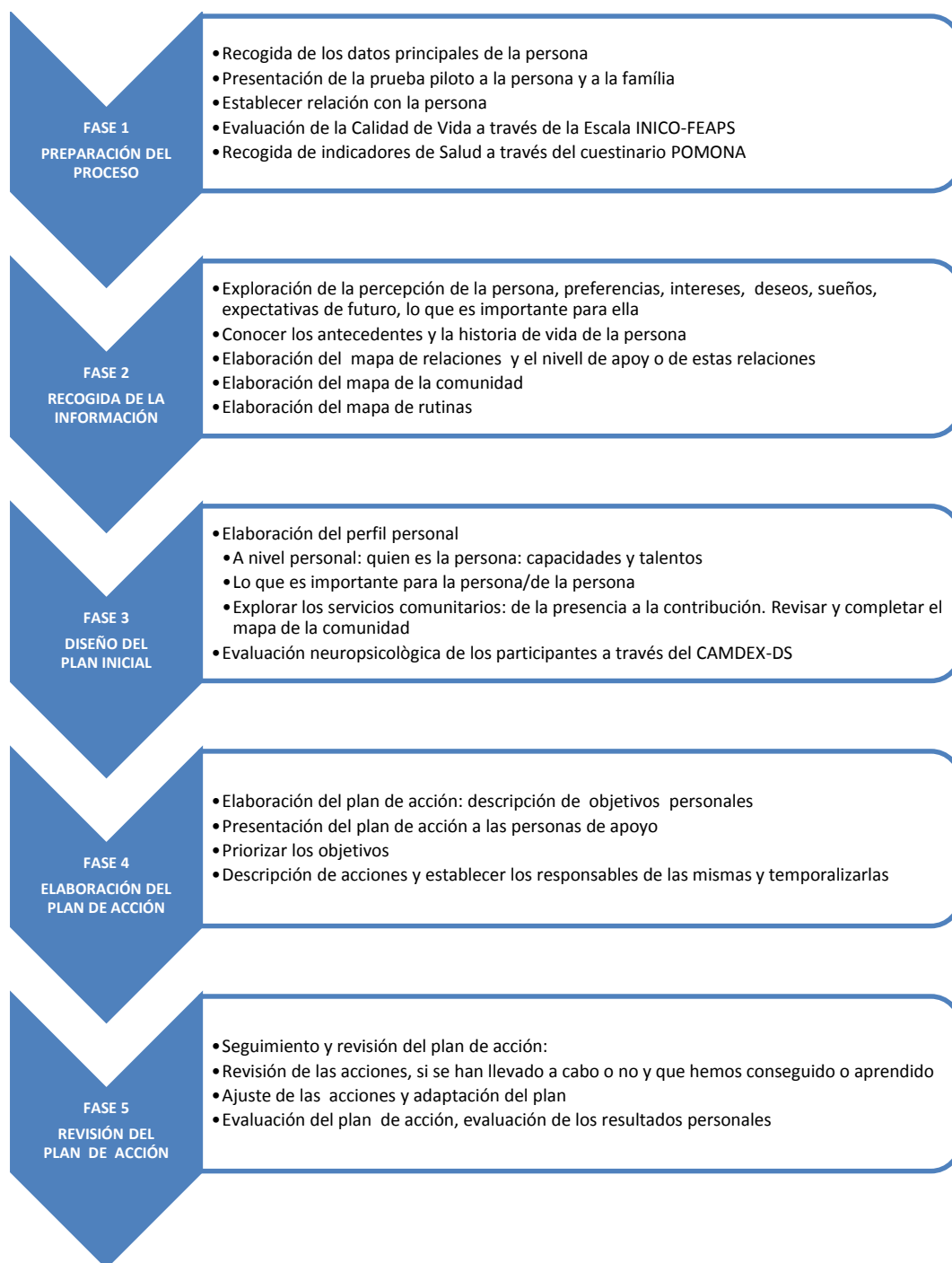
Cuadro 2: Fases de la intervención de la Unidad de Apoyo

En todas las fases de la intervención se ha situado la persona en el centro, basándonos en el principio y derecho de autodeterminación y la necesidad de ofrecerle los apoyos para ayudarle a tener mayor control sobre su propia vida, y partiendo del momento de transición de vida en el que se encuentra.